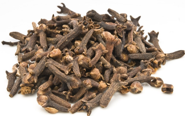
Clous de Girofle